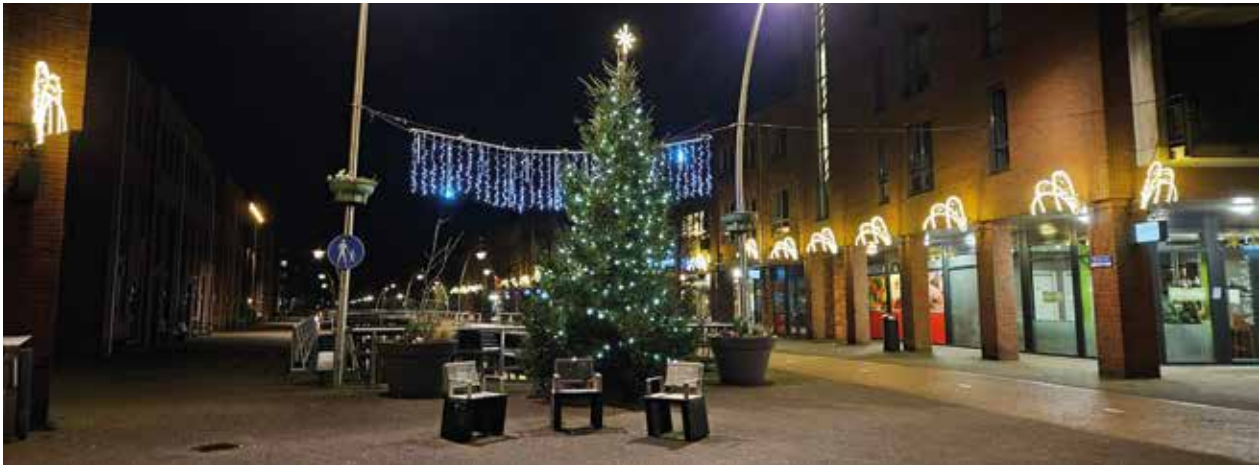
Kersttijd in Drielanden