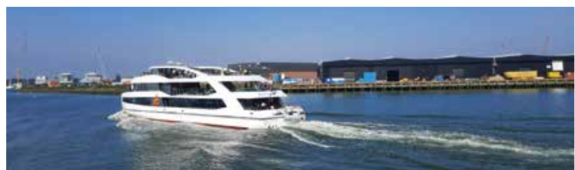
Spido boot voor de tocht over de Maas

Terug bij de Zwaan zochten we de bussen op en vertrokken rond de spits uit Rotterdam, met de gebruikelijke verkeersdrukte om ons heen. Omdat het druk was onderweg konden we extra lang genieten van de reis in de bussen. Onderweg werden inzamelingen gehouden om de chauffeurs met een extraatje te bedanken. Terug op de parkeerplaats bij de Aldi ging iedereen na een goed besteedde dag met een voldaan gevoel huiswaarts.