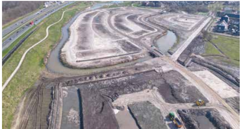
Overzicht van de wijk Harderweide

Met de bouw van deze nieuwe delen van de wijk Harderweide, wordt de bouw van de wijk Drielanden afgerond. Wat er nog wel op de agenda staat is het aanpassen van de parkeerplaats Biezenplein (bij de kerk en de scholen). In het kader van vergroening, wordt het asfalt er uit gehaald, komt er meer groen en zullen de parkeervakken worden voorzien van open stenen. Dit is prettiger voor de scholen, bij warm weer heb je dan meer verkoeling en schaduw