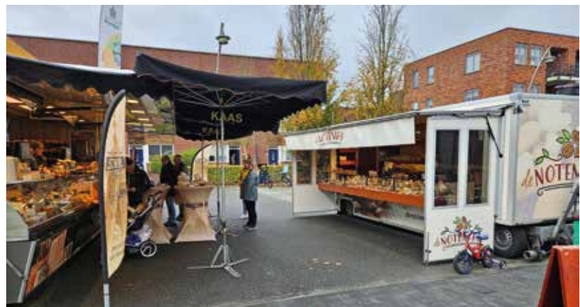
De NOTENKAR op de markt Drielanden