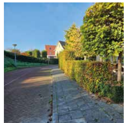
Brede en hoge heg in de bocht van de weg (als er plek voor is)