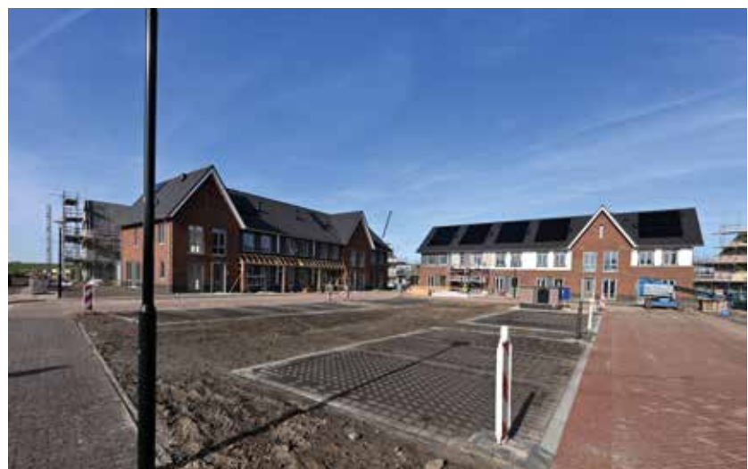
Eerste opgeleverde huizen in de nieuwe wijk