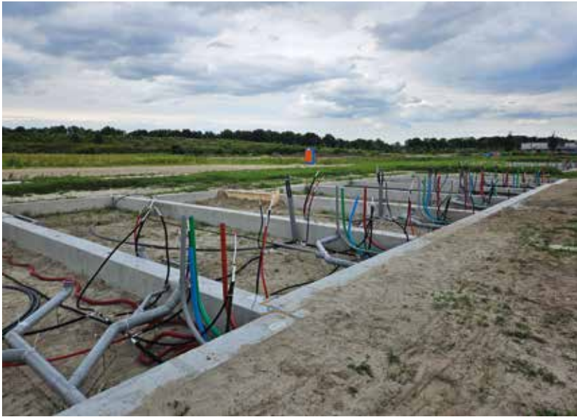
Infrastructuur NUTS voorzieningen voor de huizen

wijk staan aan het begin van de Spijkweg en aan de Horloseweg. Naast elektriciteit water en riool (NUTS-voorzieningen) wordt elk huis ook voorzien van een glasvezelaansluiting van de CAI Harderwijk zie Hoorschelp 2024-1). Inmiddels hebben de eerste bewoners de sleutel ontvangen en zijn zij druk het huis in te richten.