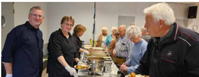
Jops catering verzorgt de maaltijd

Op 15 oktober hadden we weer onze Indische rijstmaaltijd. De aankondigingen waren gedaan in de Hoorschelp, op onze facebook pagina en aan de leden werd de uitnodiging nog eens via de mail gedaan.