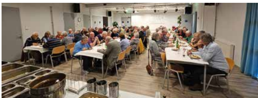
84 personen genieten van de Indische rijstmaaltijd