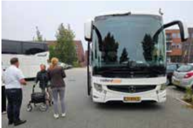
Midland verzorgt de reis

Wijkvereniging Drielanden had voor leden en belangstellenden een busreis georganiseerd, op 19 september jongstleden.