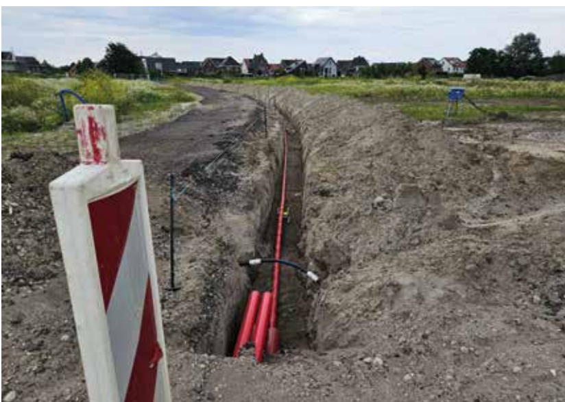
Elektriciteitsvoorzieningen voor de wijk

Harderweide is een wijk waar het buitenleven centraal staat, zo staat op