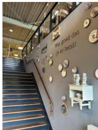
Trap naar de winkel

Het Goed is een grote winkel die met een winkeloppervlak van ruim 1.500 m 2 net buiten onze wijk is gevestigd op het industrieterrein bij onder andere de Karwei, Totaalbed en Cre8 Kitchen / Badkamer warenhuis. De winkel is 7 dagen per week geopend en het