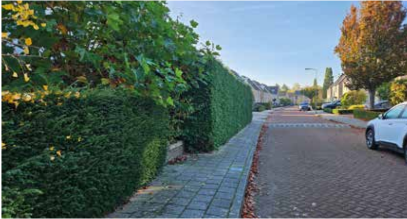
Hoge heg die over de stoep gaat

Op 23 oktober was er een wijkschouw gepland door de gemeente. Van de wijkvereniging wordt dan verwacht dat zij de mensen van de gemeente wijzen op mooie plekken in de wijk en op punten waar verbetering mogelijk is.