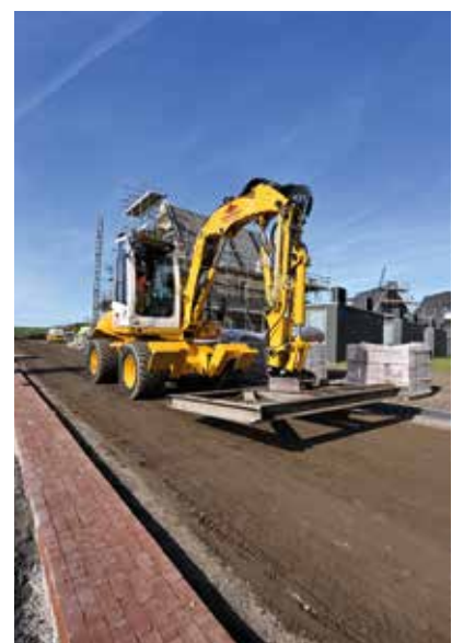
Elektrische voertuigen bouwen de wijk