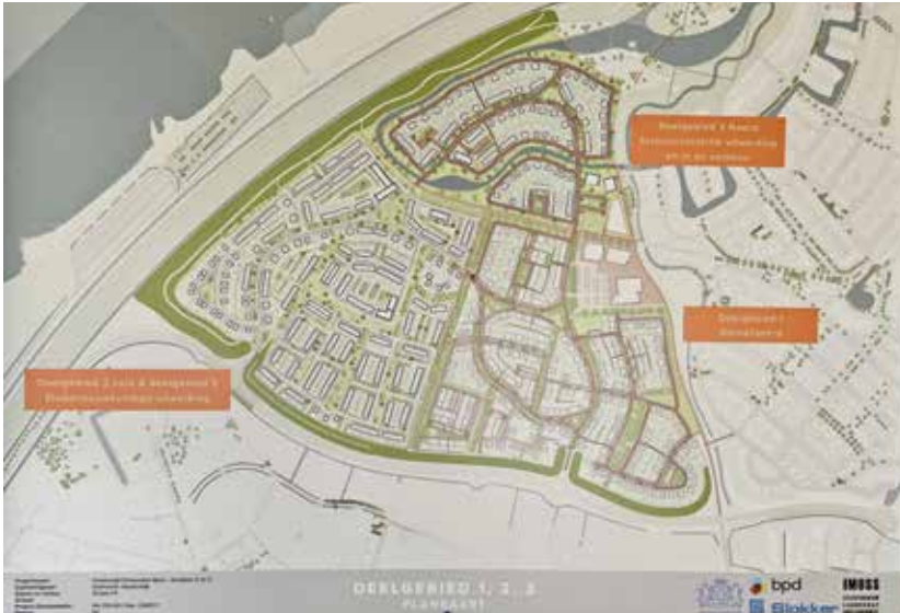
Overzicht van de bestaande en nieuw te bouwen delen van Harderweide

en deel 3 is hier extra rekening mee gehouden. Geen zwaar bouwmaterieel en bergen zand op de erven, zodat de grond niet wordt samengeperst. Er zijn extra wadi's aangebracht, ook zijn er extra infiltratieriolen (zie foto) aangebracht in het openbare gebied en bij de huizen. Hierdoor kan water eenvoudig worden afgevoerd naar de Crescentplas en uiteindelijk terecht komen in de Randmeren.