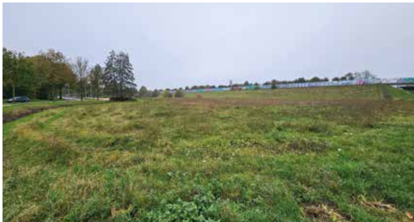
Groenstrook tussen Drielandendreef en A28

U heeft het vast wel gezien, er zijn nieuwe elektriciteitskabels gelegd en nieuwe transformatorhuisjes geplaatst, een hele grote op het Rappad. Er worden 4 kabels gelegd, 1 dikke kabel voor de wijk Harderweide en drie nieuwe kabels (3 fasen) om de stroomvoorziening in bestaande wijk Drielanden uit te breiden. In eerste instantie zal er 10.000 Volt op de kabels komen, maar de kabels zijn geschikt voor 20.000 Volt. Deze uitbreidingen zijn nodig om aan de grotere vraag naar energie te kunnen voldoen. Denk aan de laadcapaciteit voor elektrische auto's, het ondersteunen van zonnepanelen en het huishoudelijke energie gebruik wat stijgt door het gebruik van steeds meer elektrische apparaten.