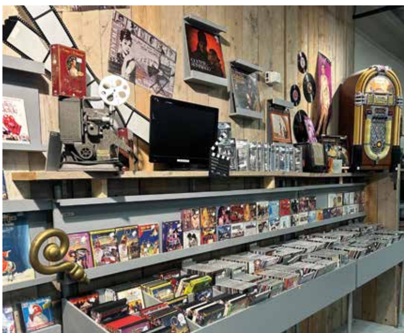
Eén van de mooi ingerichte afdelingen "Muziek"