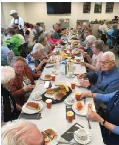
De lunch bij van Noppen

Bij van Noppen kregen we ook een heerlijke lunch voorgeschoteld, daarmee konden we de rest van het