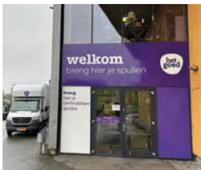
Afgifte punt voor uw herbruikbare spullen