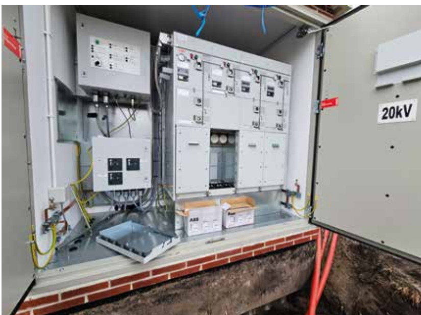
Nieuwe transformatorhuis met open deur voor kabel invoer