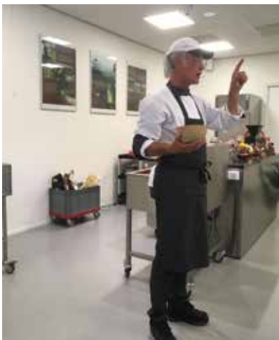
Presentatie bij Noppen Chocolate