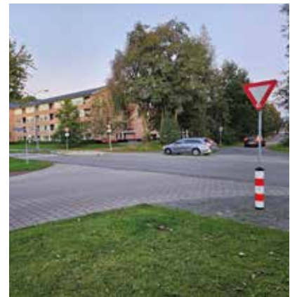
Best gevaarlijk verkeerspunt (zeker als de lampjes het niet doen)

Al met al was het redelijk veel werk om alles goed inzichtelijk te maken, maar een ieder had het gevoel dat er aandacht werd gegeven aan de genoemde punten. Ook de wethouder, de wijkmanager en wijkbeheerder en de secretaresse van de gemeente waren enthousiast over het aantal meldingen en het aantal personen dat mee ging fietsen. Hoewel er punten voor verbetering waren, kunnen we constateren dat Drielanden een erg mooie wijk is.