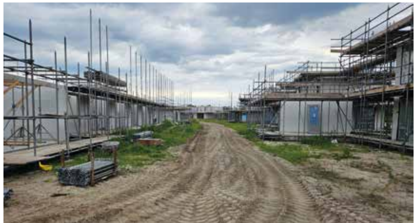
Straten waarvan de grond is aangepast om water af te kunnen voeren